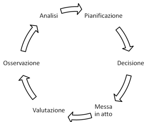
Illustrazione 2: ciclo di conduzione del progetto

Dopo la conclusione di un progetto, bisognerebbe procedere ad una valutazione in modo da adeguare la futura pianificazione della scuola in salute e sostenibile alle esperienze fatte. Questa valutazione offre la possibilità di approfittare di queste esperienze anche ad altre scuole della Rete.